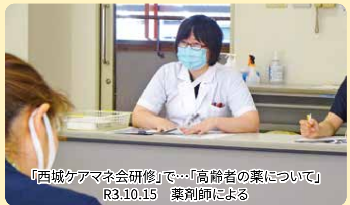
「西城ケアマネ会研修」で…「高齢者の薬について」 R3.10.15 薬剤師による