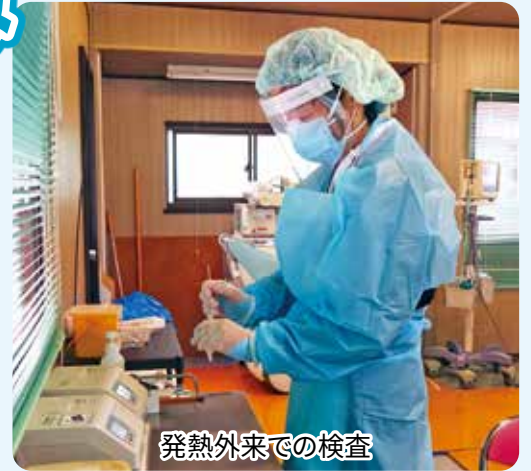
発熱外来での検査

当院でも「これ以上の感染拡大は食い止めたい」という一心で、新型コロナウイルス感染症対策本部会議（郷力事業管理者（院長）が本部長）を重ね、医療部門と介護部門の往来を禁止し、感染防止対策の強化、面会の再禁止（タブレット面会のみ可）、健診項目の制限、発熱外来継続、新型コロナワクチン追加（3回目）接種などを実施しています。早期に治療薬投与の開始が望まれます。今後もクラスターや院内感染の発生防止に取り組んでまいります。