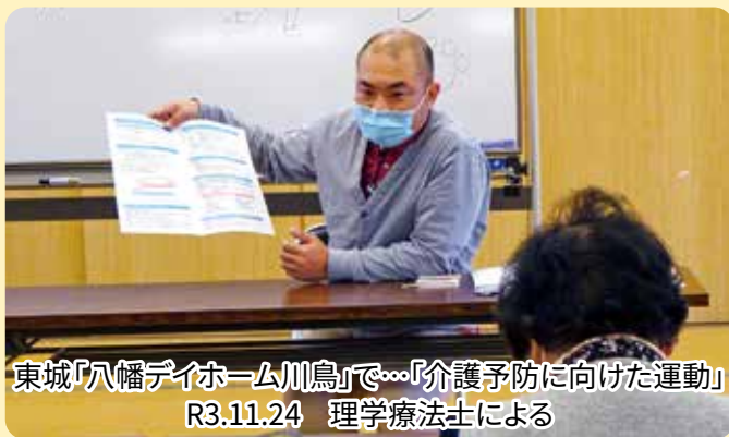
東城「八幡デイホーム川島」で…「介護予防に向けた運動」 R3.11.24 理学療法士による

■ 申し込み・問い合わせ先／西城市民病院 地域連携室 TEL 0824-82-2636 FAX 0824-82-2012