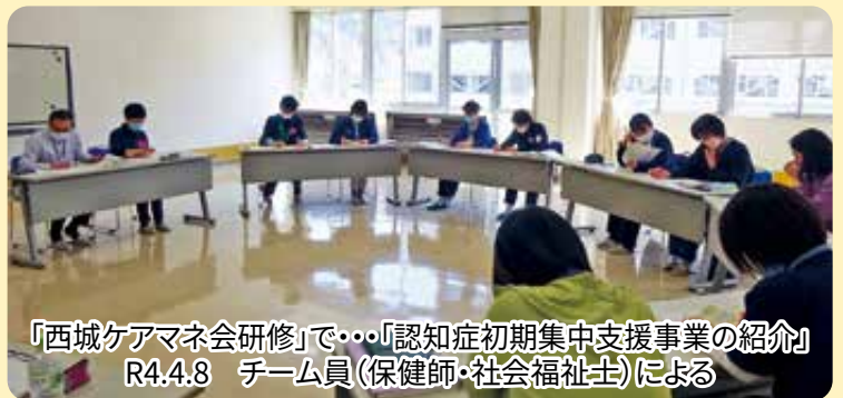
「西城ケアマネ会研修」で・・・「認知症初期集中支援事業の紹介」 R4.4.8 チーム員(保健師・社会福祉士)による