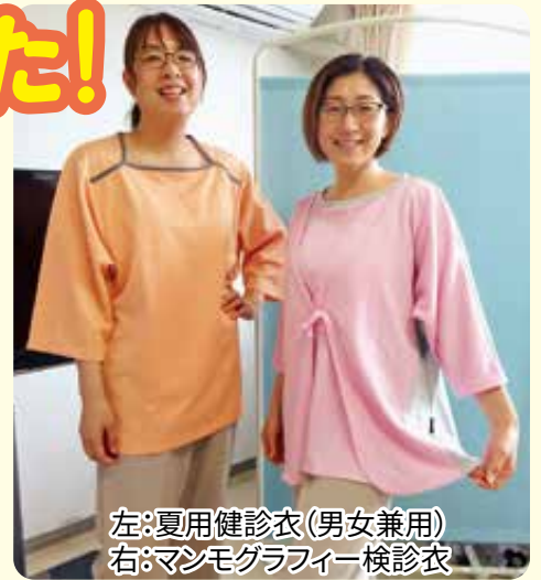
左:夏用健診衣(男女兼用) 右:マンモグラフィー検診衣