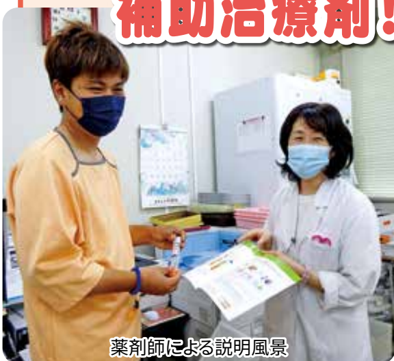
薬剤師による説明風景

アナフィラキシー補助治療剤「エピペン」は、医療機関で扱っています。来院の上、医師にご相談ください。