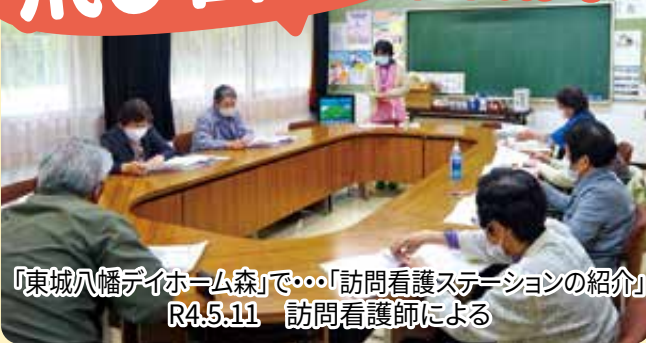
「東城八幡デイホーム森」で・・・「訪問看護ステーションの紹介」 R4.5.11 訪問看護師による

当院では、出前講座を行っています。講座は、地域と病院が、健康の大切さを共有できる場として、市民の皆さまに喜んでいただいております。