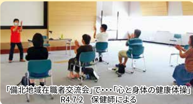
「備北地域在職者交流会」で・・・「心と身体の健康体操」 R4.7.2 保健師による

申し込み・問い合わせ先/西城市民病院 地域連携室 TEL 0824-82-2636 FAX 0824-82-2012