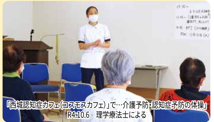
「西城認知症カフェ(コスモスカフェ)」で…介護予防・認知症予防の体操 R4.10.6 理学療法士による