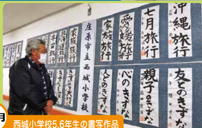
10月 西城小学校5.6年生の書写作品