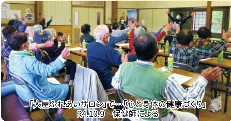
「大屋ふれあいサロン」で…「心と身体健康づくり」 R4.10.9 保健師による