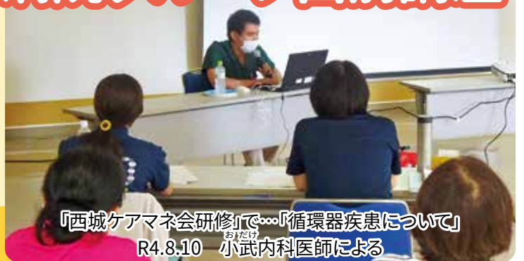
「西城ケアマネ会研修」で…「循環器疾患について」 R4.8.10 小武内科医師による

申し込み・問い合わせ先/西城市民病院 地域連携室 TEL 0824-82-2636 FAX 0824-82-2012