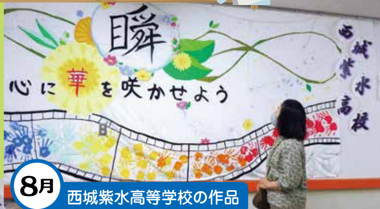
8月 西城紫水高等学校の作品