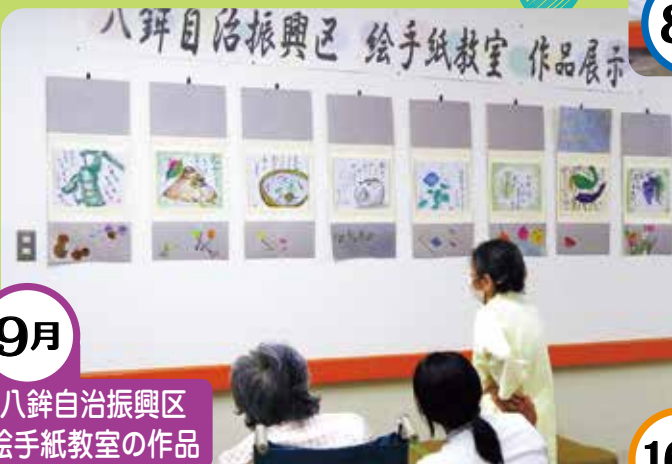
9月 八鉾自治振興区 絵手紙教室の作品