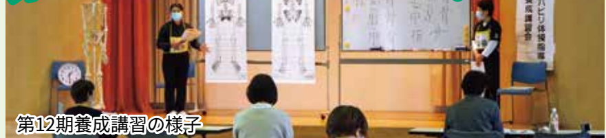
第12期養成講習の様子

庄原市シルバーリハビリ体操2級指導士養成講習会の第12期が9月21日(水)～11月9日(水)の期間で8回、庄原市ふれあいセンターで行われました。講習会には当院から郷土院長や理学療法士、保健師が講義や体操指導に出向いています。コロナ禍での講習会ではありますが、感染予防を徹底し、実施しています。講習を終えた修了者は、庄原市シルバーリハビリ体操指導士会の一員として、普及活動を開始されます。講習会の修了者数は151名となりました。一人でも多くの市民の皆さまにシルバーリハビリ体操を学んでいただきたいです。