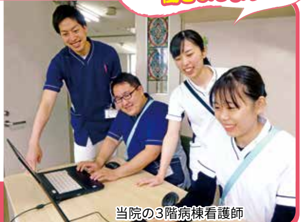
当院の3階病棟看護師

■ 申し込み・問い合わせ先/西城市民病院 医療総務係 TEL 0824-82-2611