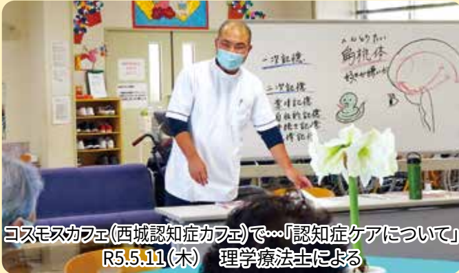
コスモスカフェ(西城認知症カフェ)で…「認知症ケアについて」 R5.5.11(木) 理学療法士による