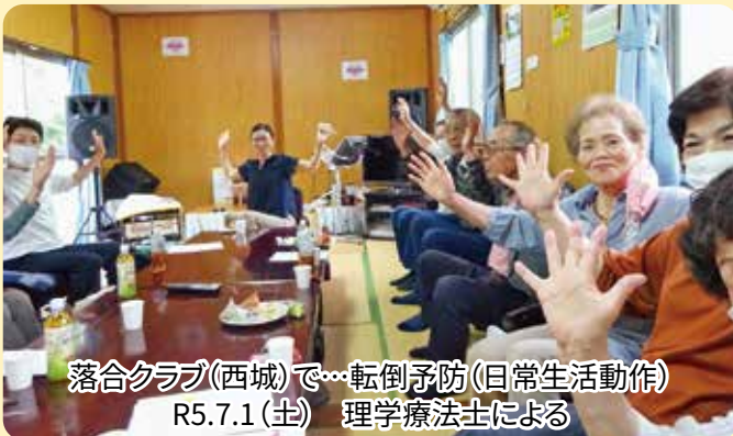
落合クラブ(西城)で…転倒予防(日常生活動作) R5.7.1(土) 理学療法士による