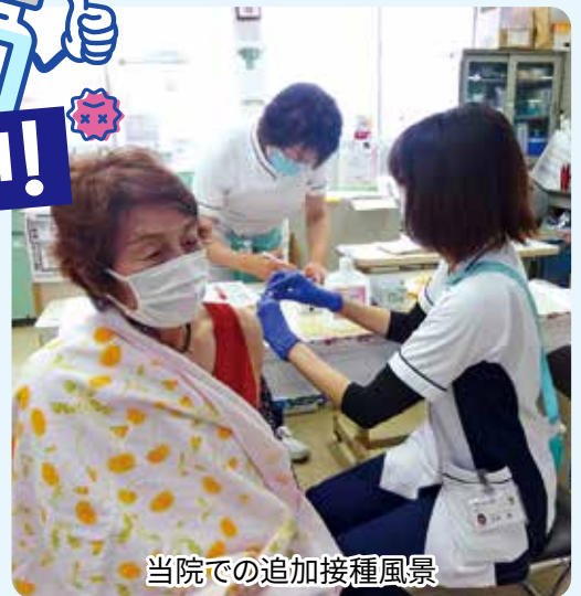
当院での追加接種風景

新型コロナウイルス感染症が「5類感染症」に移行しても、ウイルスの特性や感染リスクは変わらないことから、手洗いや換気、医療機関や高齢者施設でのマスク着用など、基本的な感染対策の取り組みが大切です。