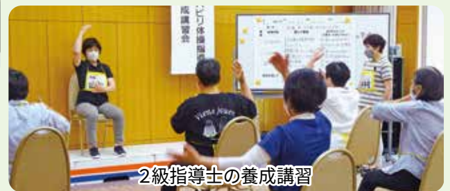
2級指導士の養成講習

7月26日、8日間の実習を終え、庄原市で初めてシルバーリハビリ体操1級指導士が6名誕生しました。1級指導士は地域の方々に体操を伝えるだけでなく、2級指導士の養成をする役割があります。1級指導士の誕生により、シルバーリハビリ体操が、より地域に根付くことと期待しています。