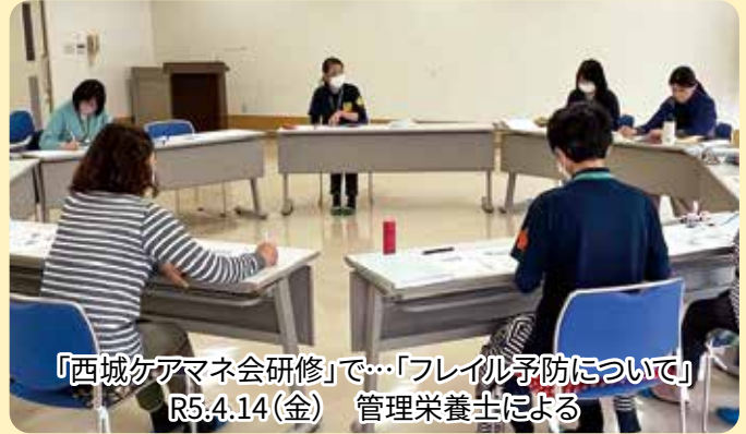
『西城ケアマネ会研修』で…「フレイル予防について」 R5.4.14(金) 管理栄養士による

■ 申し込み・問い合わせ先／ 西城市民病院 地域連携室 TEL 0824-82-2636 FAX 0824-82-2012