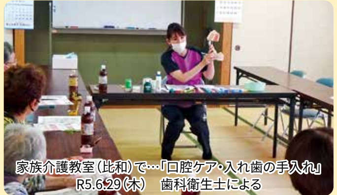
家族介護教室(比和)で…「口腔ケア・入れ歯の手入れ」 R5.6.29(木) 歯科衛生士による