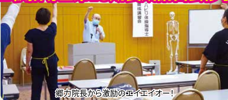
郷力院長から激励のエイエイオー!