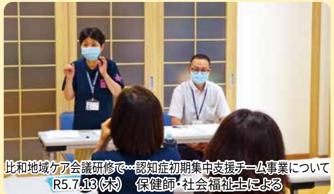
比和地域ケア会議研修で…認知症初期集中支援チーム事業について R5.7.13(木) 保健師・社会福祉士による