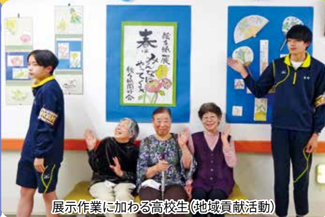
展示作業に加わる高校生(地域貢献活動)