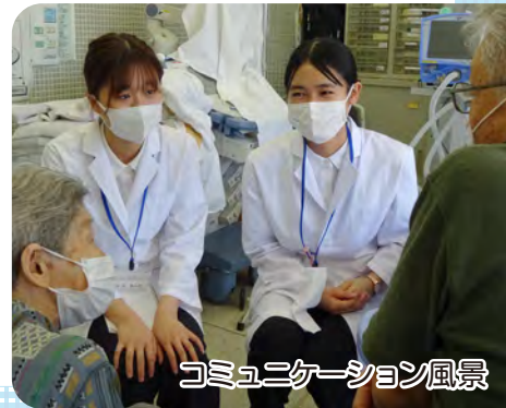
コミュニケーション風景