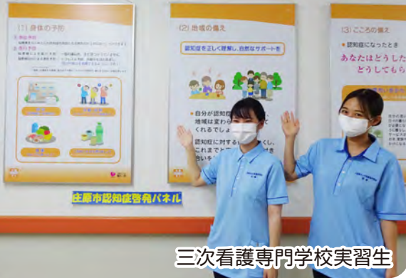
三次看護専門学校実習生