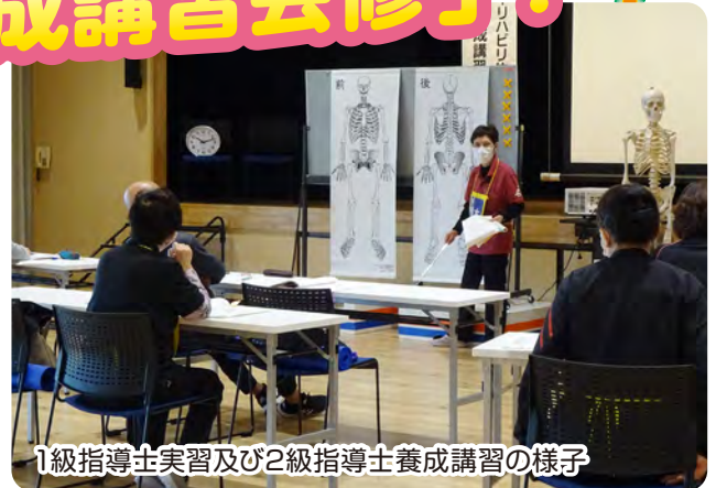
1級指導士実習及び2級指導士養成講習の様子