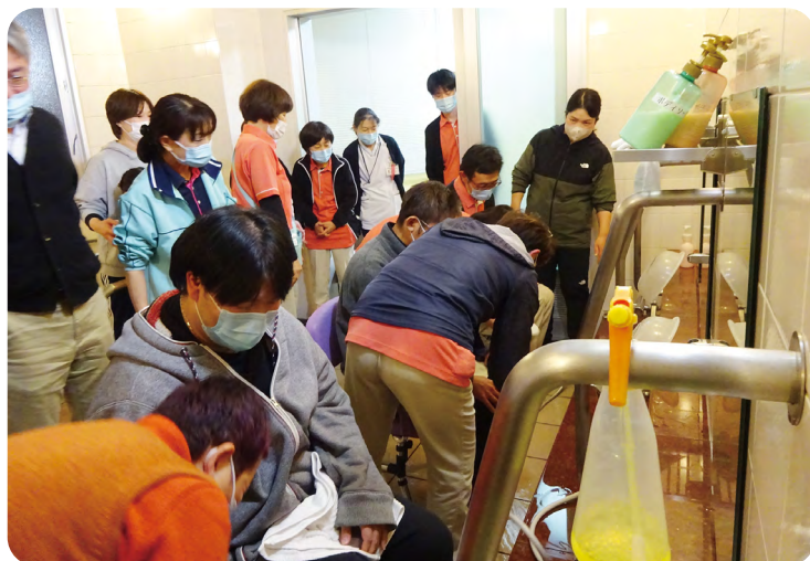
通所介護事業所での「入浴介助」研修

当院の介護事業所が企画した職員研修会が開催され、看護・介護部門の職員が参加しました。テーマは「入浴介助」です。看護師や介護福祉士など日ごろの業務で対応している職員が実践しながら、基本動作を確認する内容でした。