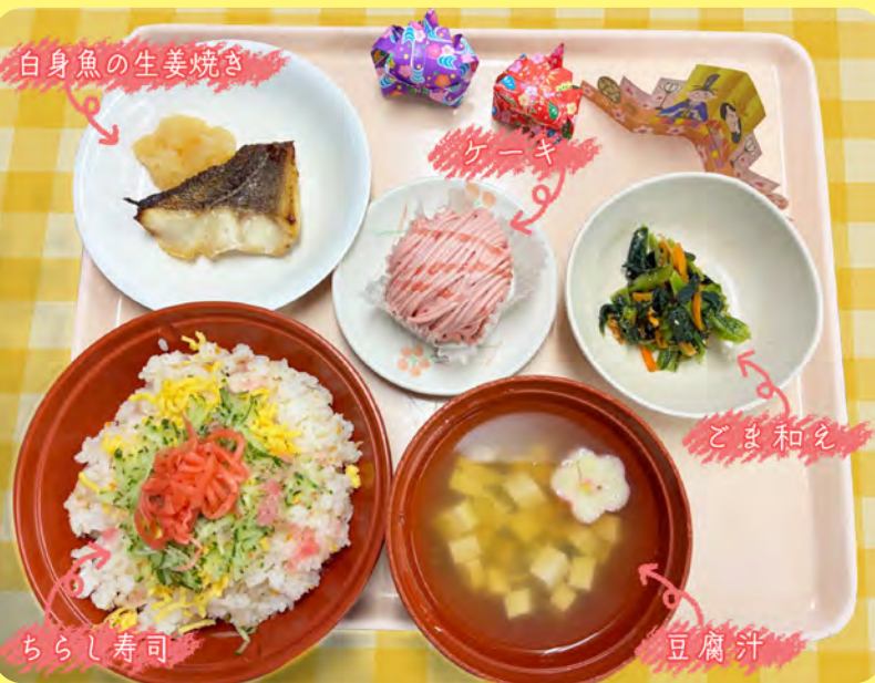
白身魚の生姜焼き